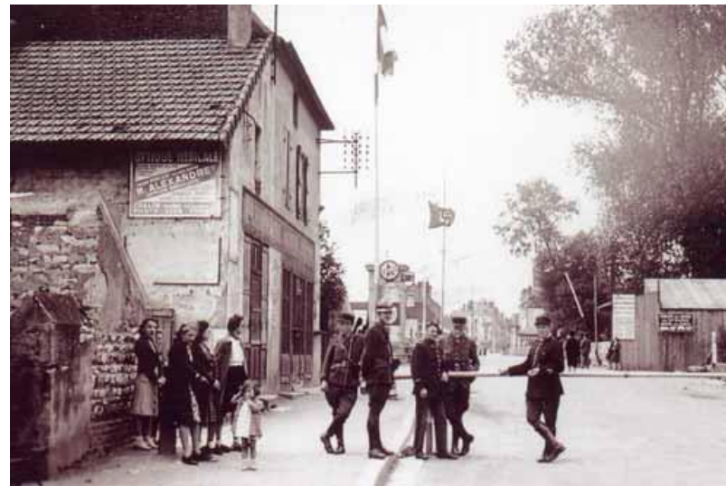
Ligne de démarcation - poste de contrôle français - 1941.