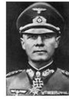
Le maréchal Rommel