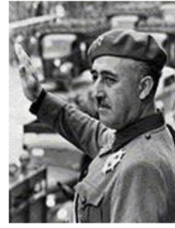
Le général Franco