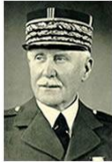
Le maréchal Pétain

Qui était cet officier Français qui jouera également un rôle très important en France par la suite ? ( clique sur son portrait )