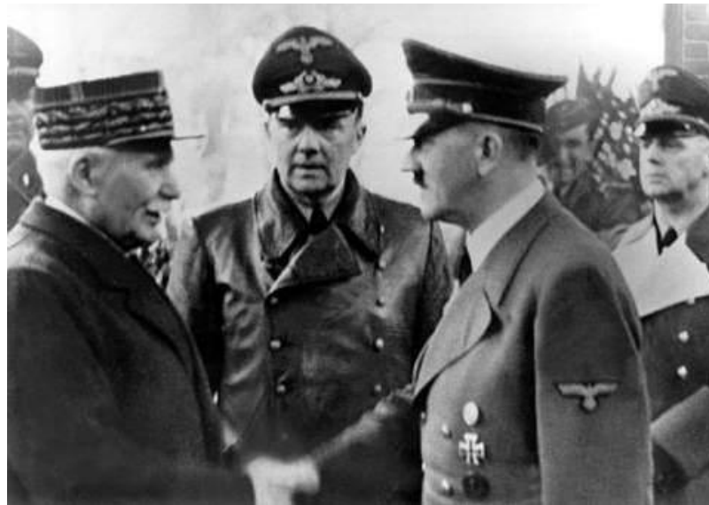
Le 24 octobre 1940, Philippe Pétain, chef de l'État français, rencontre Hitler dans la petite gare de Montoire-sur-le-Loir.