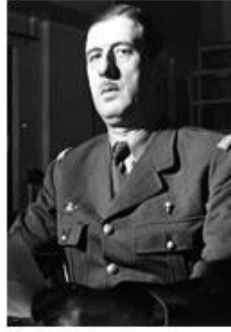
Le général de Gaulle