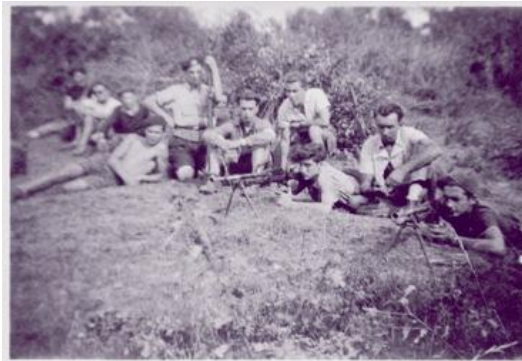
Un groupe de maquisards