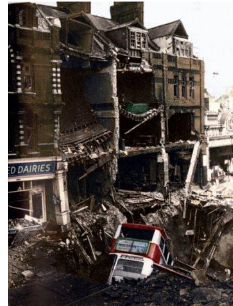
Un quartier de Londres après un bombardement allemand.