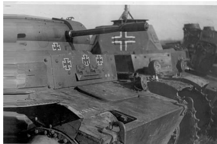
Chars allemands au début de l'opération Barbarossa.